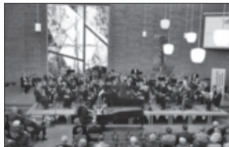
Werkgroep lunchconcerten / "Muziek in de Koningkerk"

Mocht u op 30 april verhinderd zijn: tijdens het daarop volgende lunchconcert op 25 mei kunt u (om 12.00 uur) komen luisteren naar Andrew Wright en een aantal van zijn leerlingen.